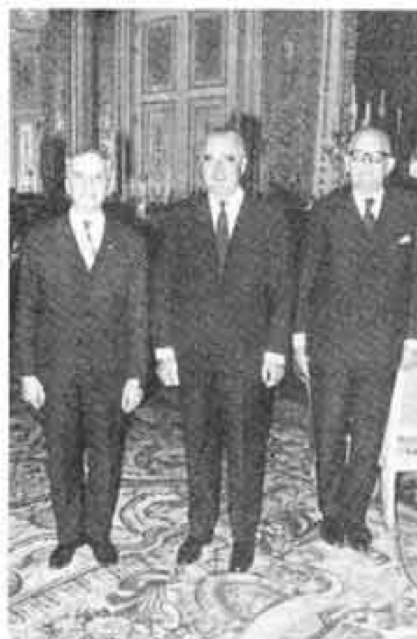
دومین رئیس ساواک، سرلشکر حسن پاکروان، به عنوان سفیر کبیر ایران در فرانسه، اعتبار نامه‌اش را به پرزیدنت ژرژ پمپیدو تقدیم می‌کند. (۱۶ اکتبر ۱۹۶۹)