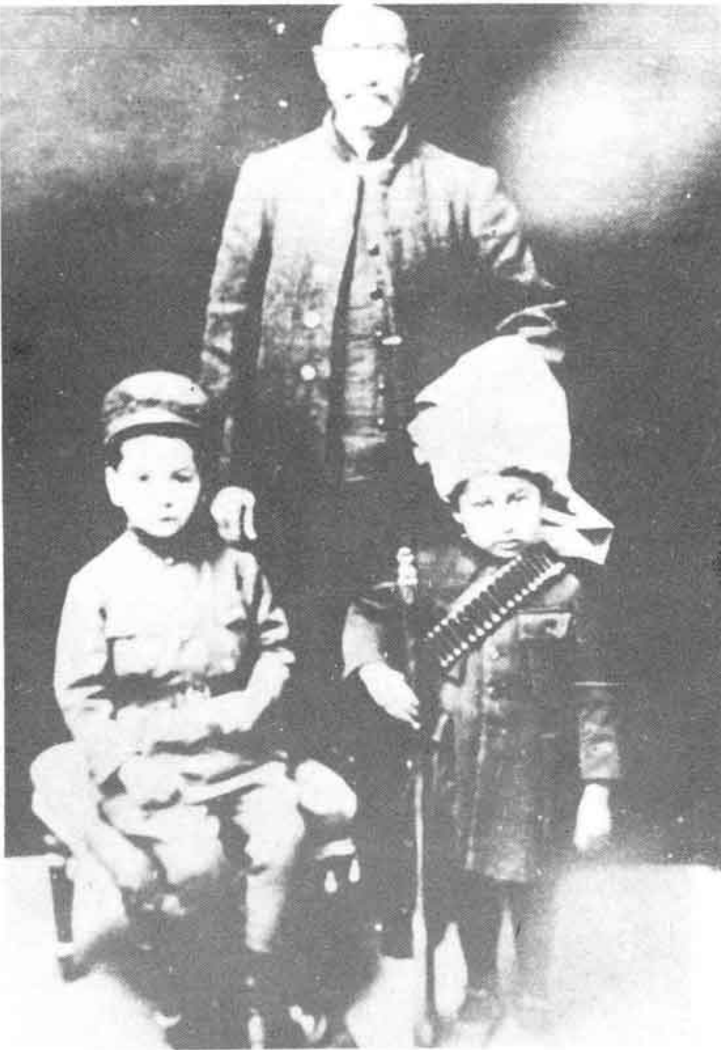
رضا شاه، بنیانگذار سلسله پهلوی با دو فرزندش: محمد رضا، ولیعهد، و خواهر توأمانش،