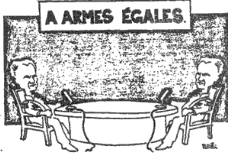
(Dessin de PLANTU.)

lection de la Constitution et des lois. Quant à ceux qui rejettent ces bases et ces principes et sont à la solde de l'étranger, les adeptes de l'idéologie « Toudéh » (parti communiste iranien, interdit), ils n'ont qu'à quitter le pays, nous ne les retiendrons pas. » Le chah a encore déclaré que le système « pluraliste », auquel il venait de mettre fin, « empêchait de très nombreux citoyens ayant les qualifications nécessaires d'accéder à des postes de responsabilité dans l'administration,