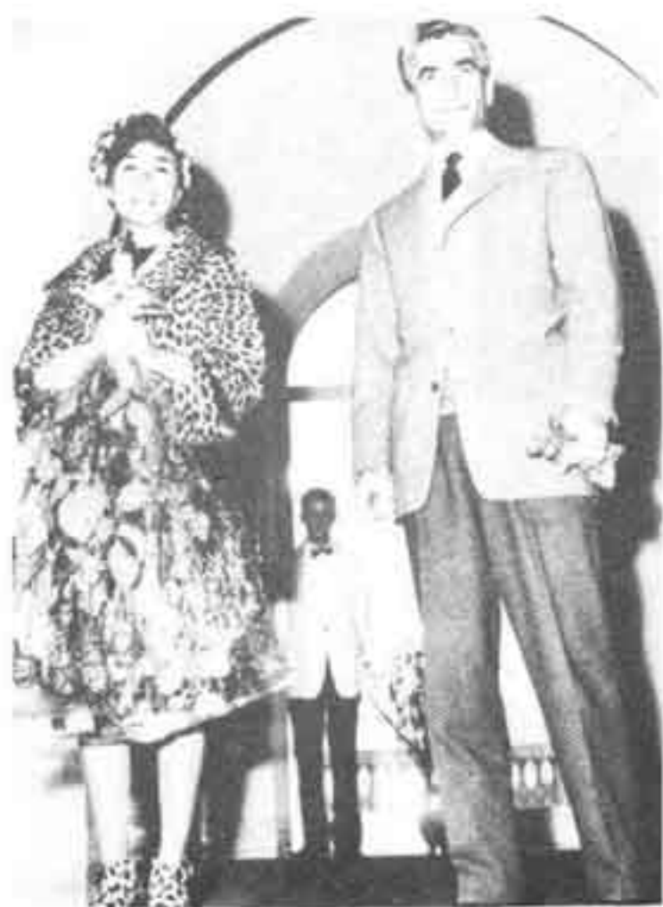
شاه و فرح در یک سفر خصوصی به ایتالیا (۱۳۴۴)