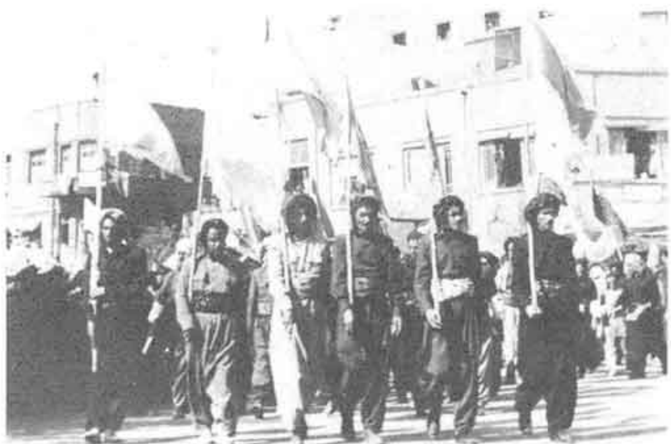
یک سال پس از کودتای ۲۸ مرداد ۱۳۳۲، شاه سالروز بازگشتش به قدرت را جشن می‌گیرد. رؤسای عشایر (در عکس کردها) مجبورند وفاداریشان را به شاه با شرکت در رژه اعلام کنند.