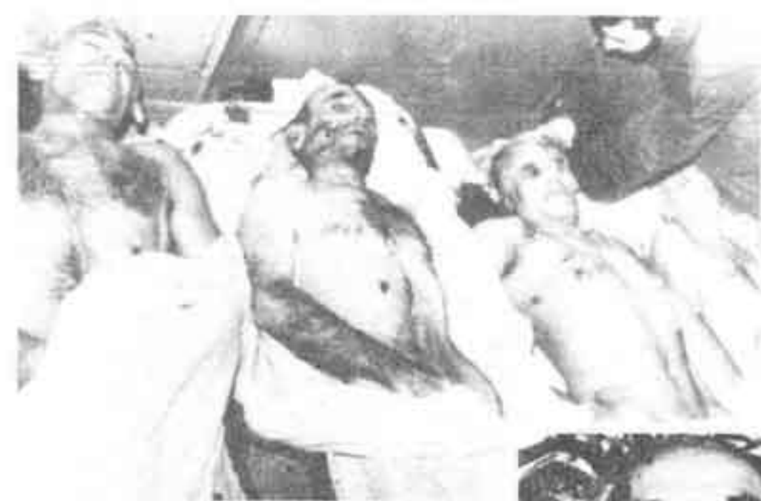
۲۸ بهمن ۱۳۵۷: جنازه‌های چهار تن از نخستین اعدام شدگان دادگاه انقلاب اسلامی، از چپ به راست: خسرو داد، فرمانده هوا نیروز؛ رضا ناجی، فرماندار نظامی اصفهان؛ مهدی رحیمی، فرماندار نظامی تهران و ارتشبد نصیری.