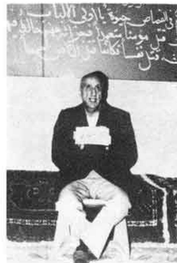
۲۸ بهمن ۱۳۵۷: ارتشبد نصیری به عنوان مقصد فی الارض در دادگاه انقلاب اسلامی محاکمه می‌شود.