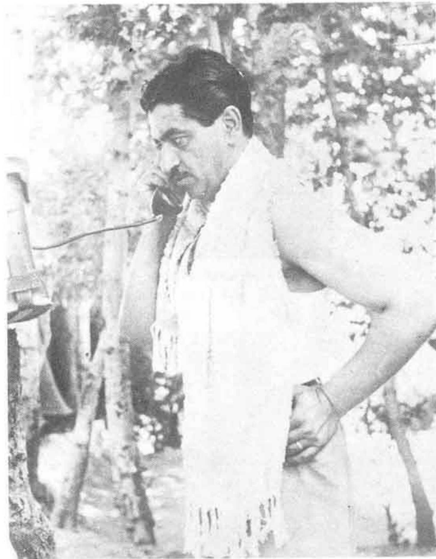
تیمور بختیار، اولین رئیس ساواک، مردی خود شیفته، دوست داشت خودش را نیرومندترین مرد ایران بنامد.