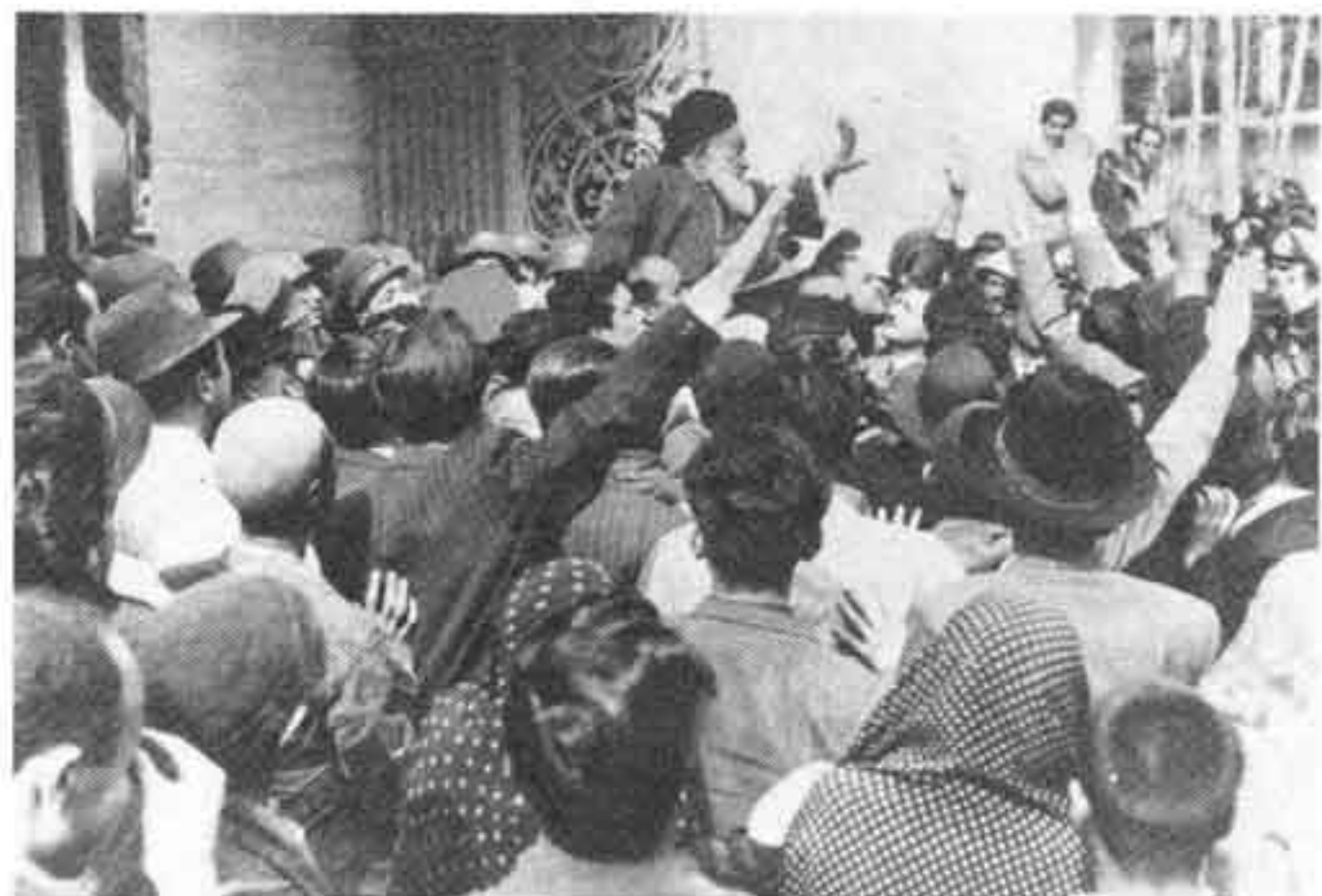
در آخرین ماههای دولت مصدق، تظاهراتی به طرفداری از شاه به سردستگی آیت‌الله بهبهانی در برابر کاخ سلطنتی.