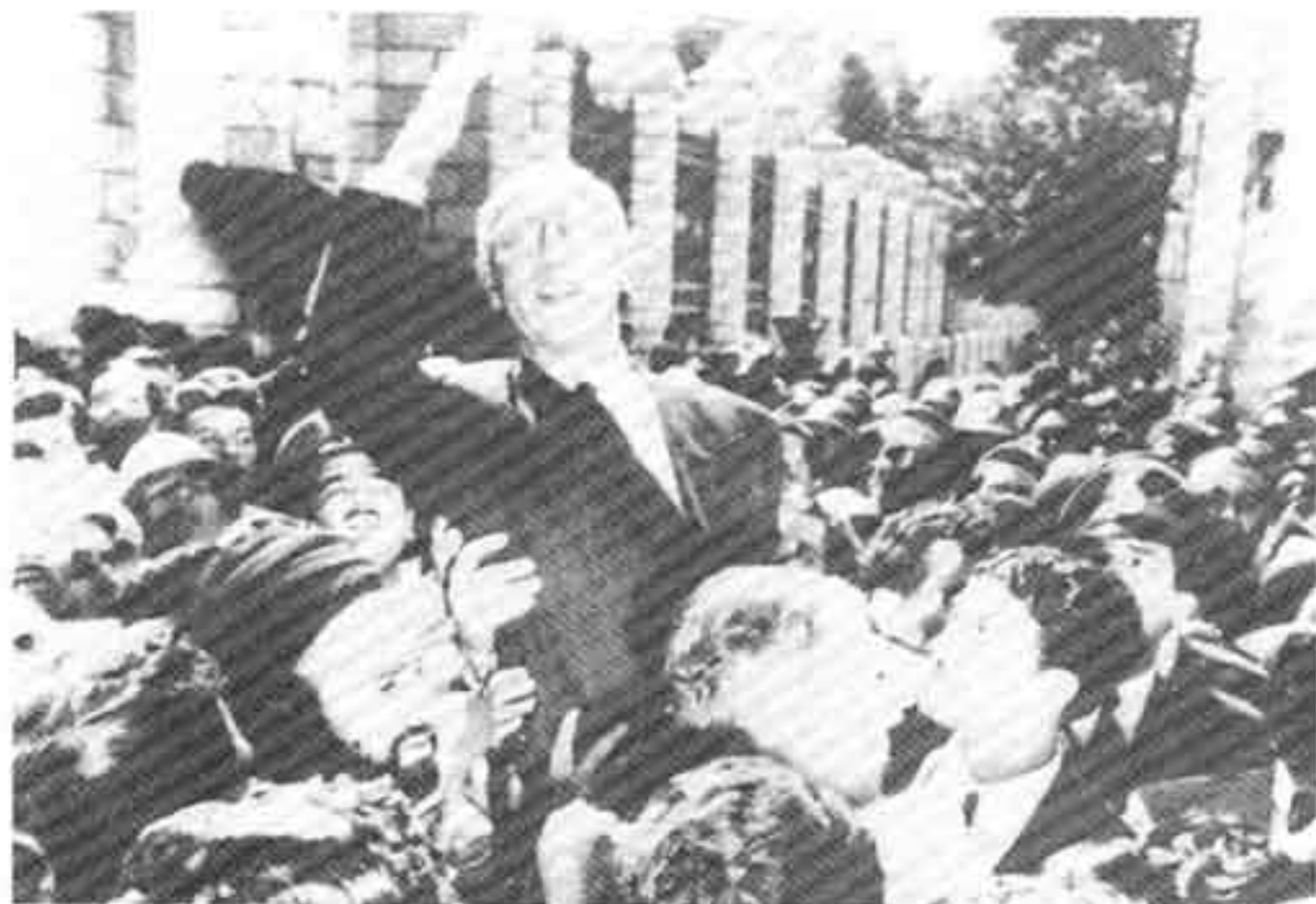
مصدق، نخست‌وزیر، در میان هوادارانش (۱۳۳۱)