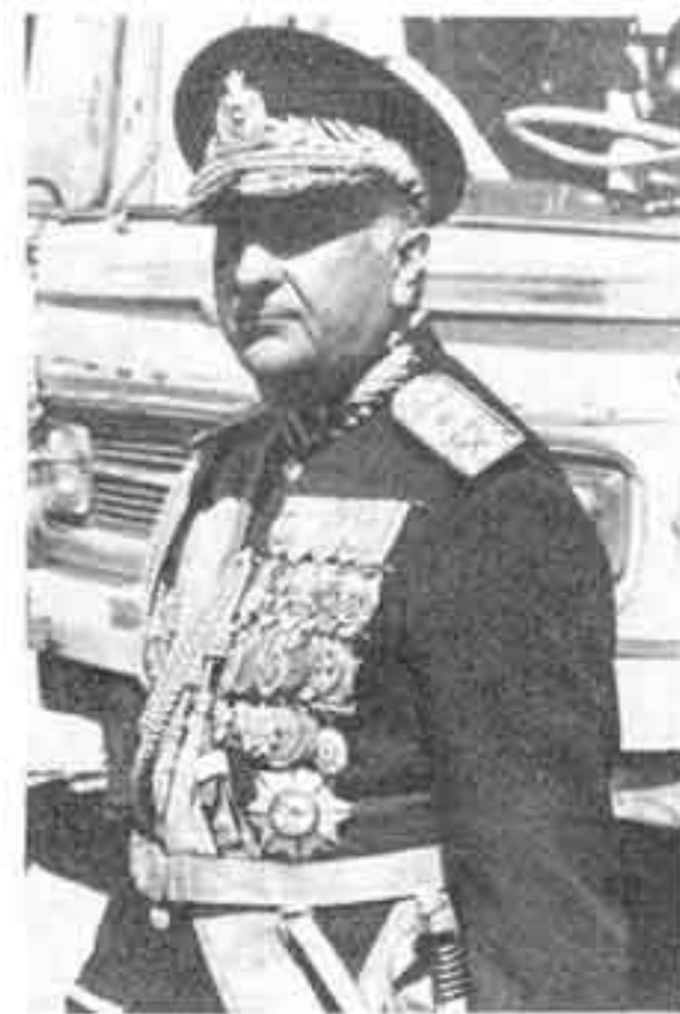
ارتشبد نصیری، سومین رئیس ساواک در ۱۳۵۰