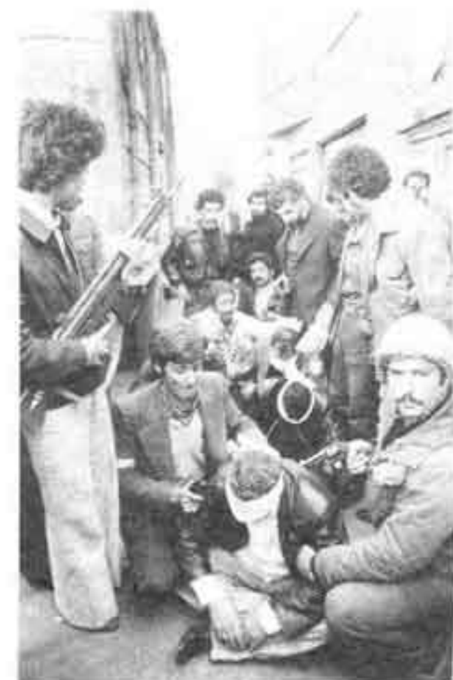
۳۰ بهمن ۵۷: ساواکیها در تهران دستگیر می‌شوند.