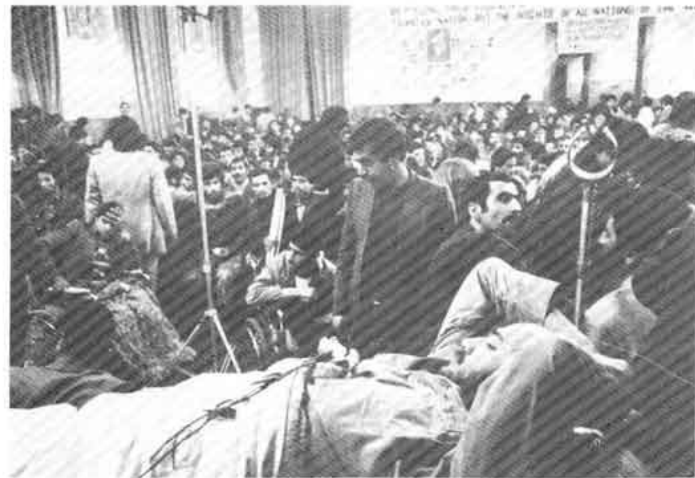
به هنگام دیدار کورت والدهایم، دبیرکل سازمان ملل، در تهران در ژانویه ۱۹۸۰، تظاهراتی از سوی قربانیان ساواک ترتیب داده می‌شود.