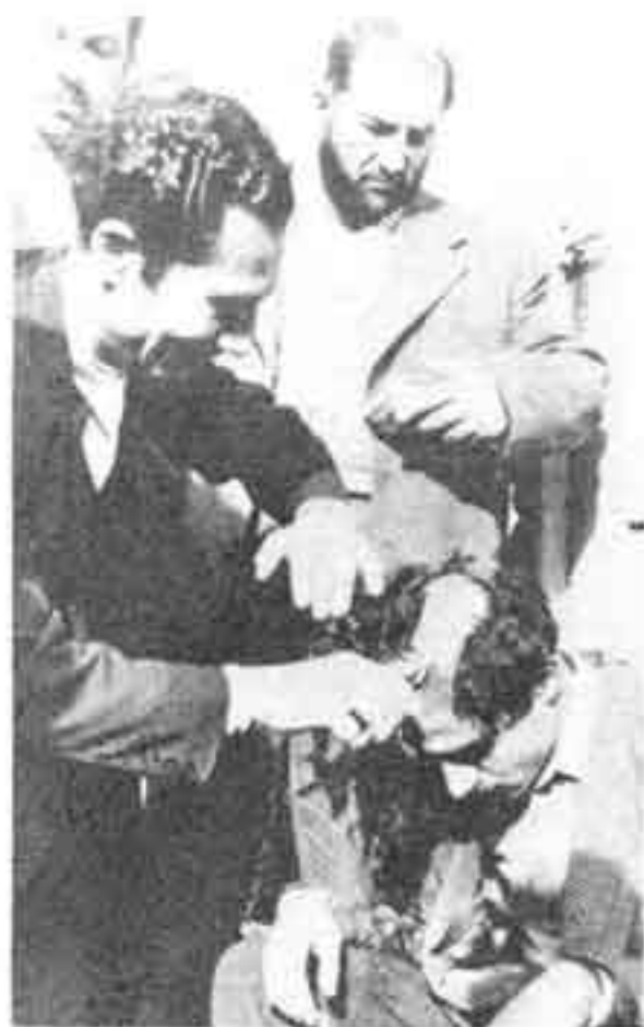
بهمن ۱۳۳۳: توده‌ایها را در خیابانهای تهران شکار کرده و در برابر عابران سرشان را می‌تراشند.